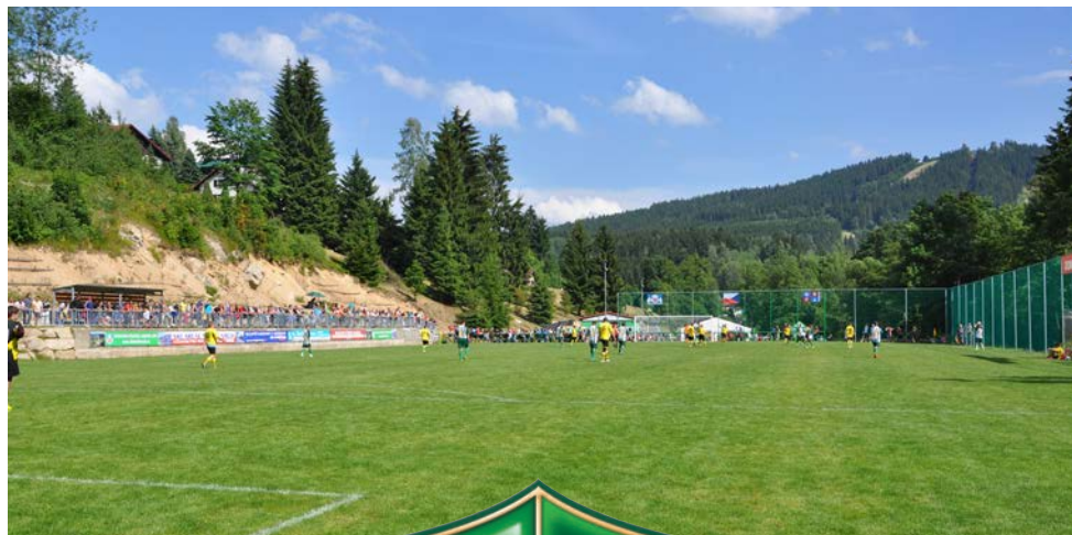
Albrechtice v Jizerských horách